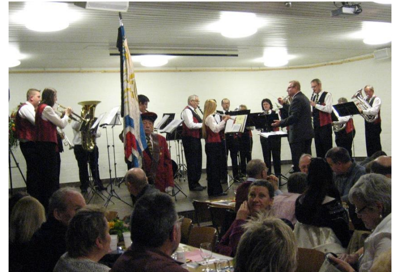
Die MG beim Auftritt im Pfarreisaal