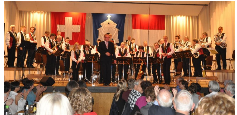
Verein an der Abendunterhaltung in Starrkirch-Wil